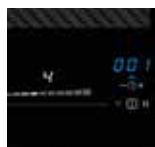
Übersichtlich: Slider-LED weiß, Timer-LED blau